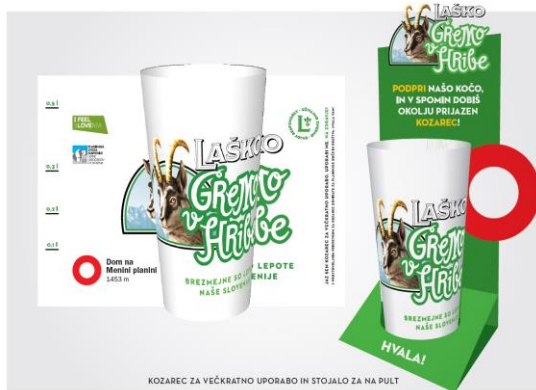
KOZAREC ZA VEČKRATNO UPORABO IN STOJALO ZA NA PULT