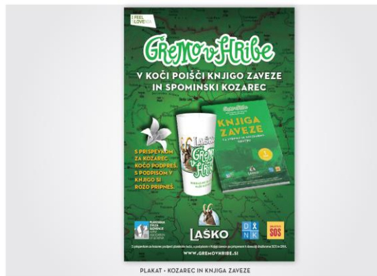
PLAKAT - KOZAREC IN KNJIGA ZAVEZE