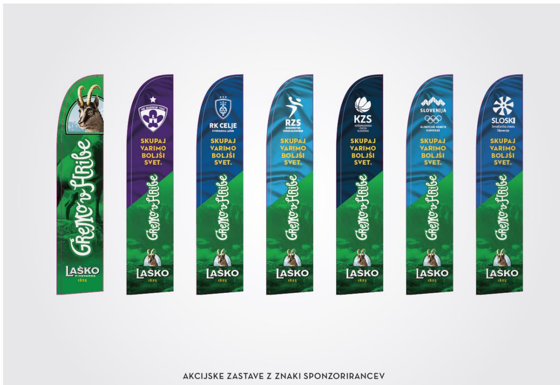
AKCIJSKE ZASTAVE Z ZNAKI SPONZORIRANCEV